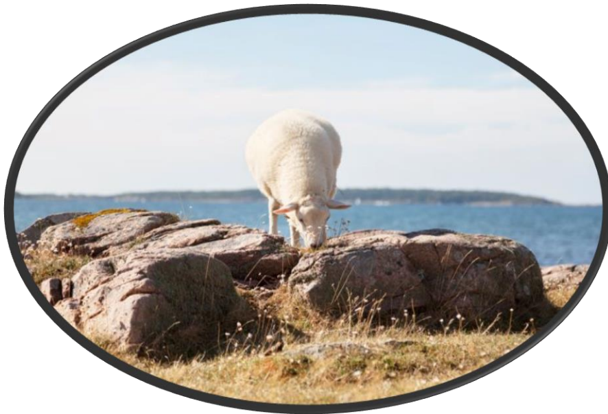
Figur 1