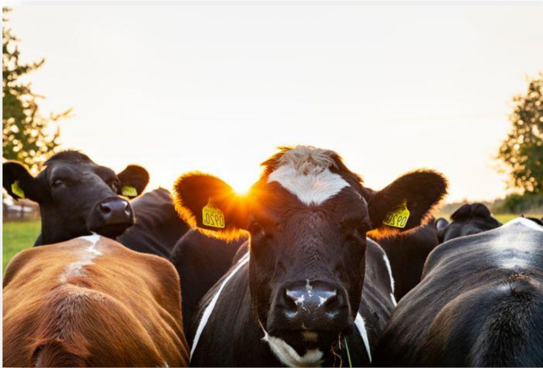
Figur 1 Foto: