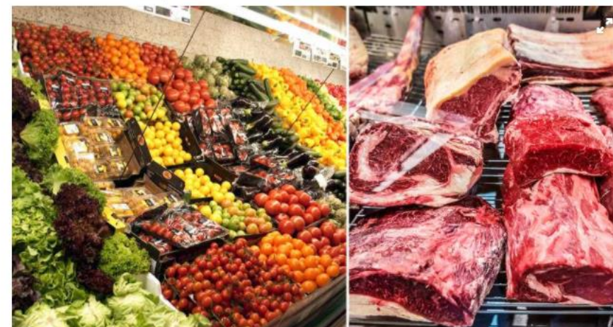
Mer bonus till den som handlar frukt och grönt. Arkivbild.

PUBLICERAD: I GÅR 12.20 | UPPDATERAD: I GÅR 13.09