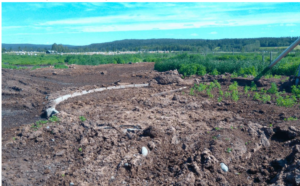
Figur 5

Större läckage eller avrinning sker eller har skett.