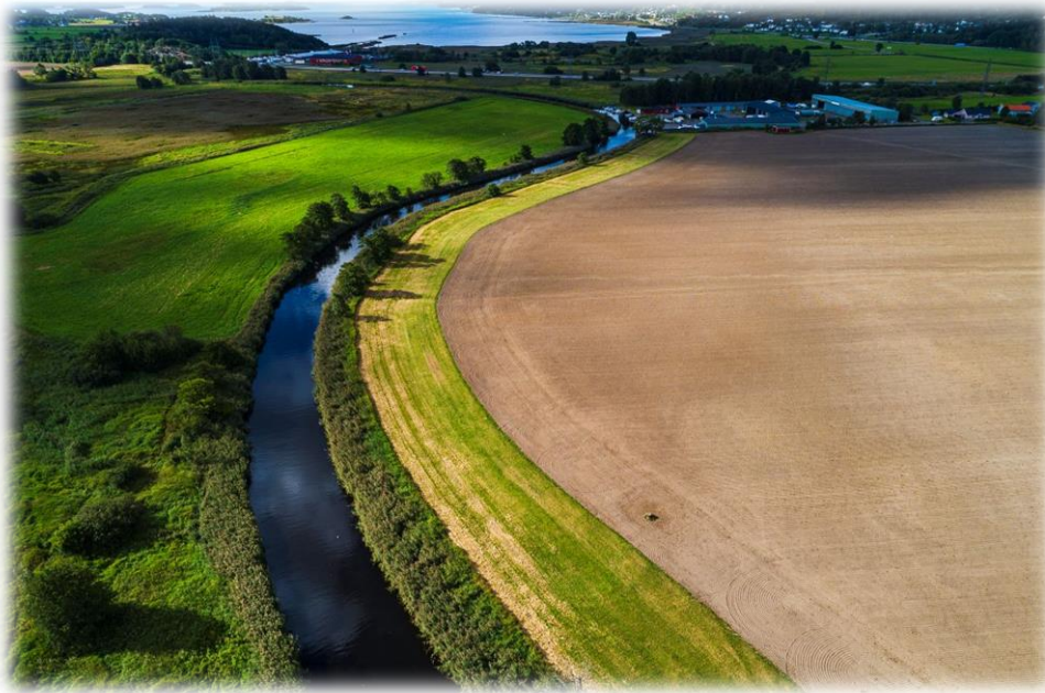
Figur 1 Jordbrukslandskap med vattendrag