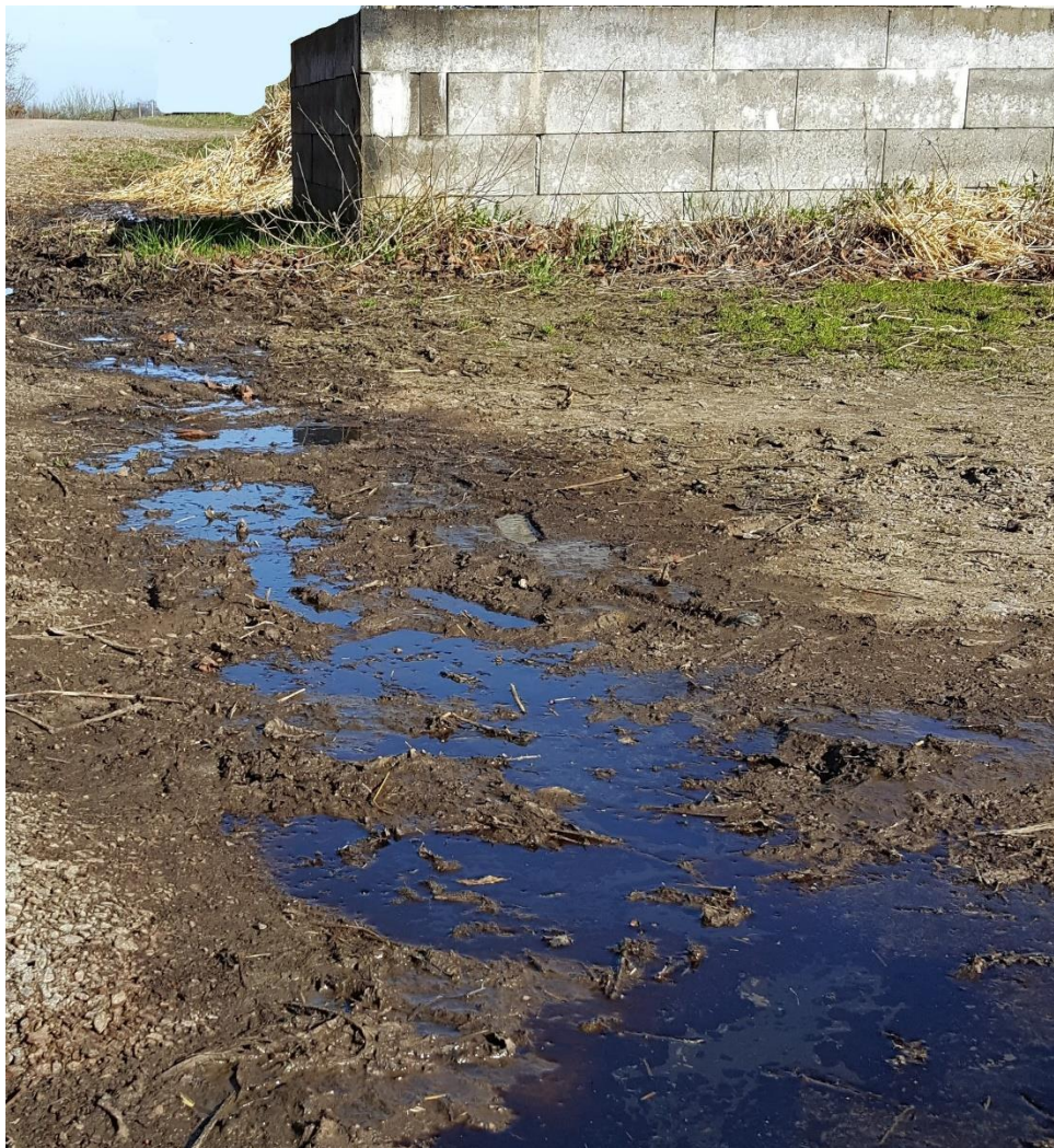
Figur 4 Foto: Ena Hansson (retuscherad bild)

Läckage eller avrinning sker eller har skett.