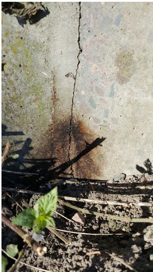
Figur 3

Mindre läckage eller avrinning sker eller har skett.